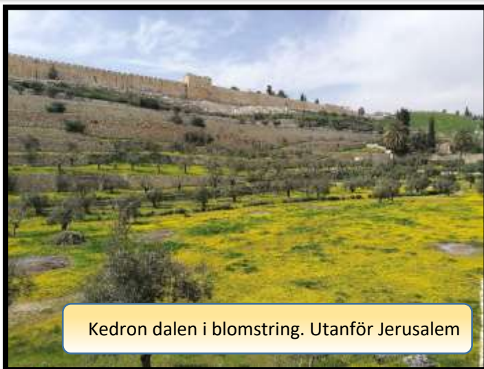
Kedron dalen i blomstring. Utanför Jerusalem