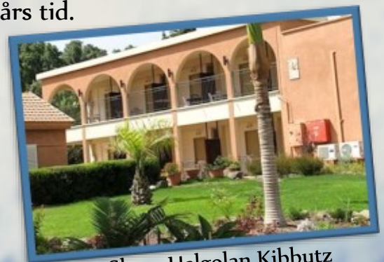
Shaar Hagan Kibbutz

Klimatkompensera resan? Javisst, läs mer på vår hemsida eller fråga oss!