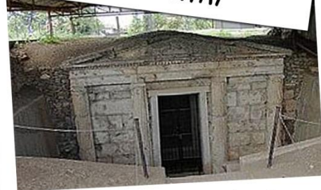
Gravplats i Verigna