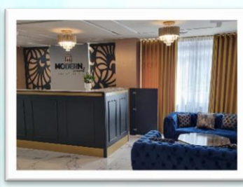
Modern revival luxury hotel