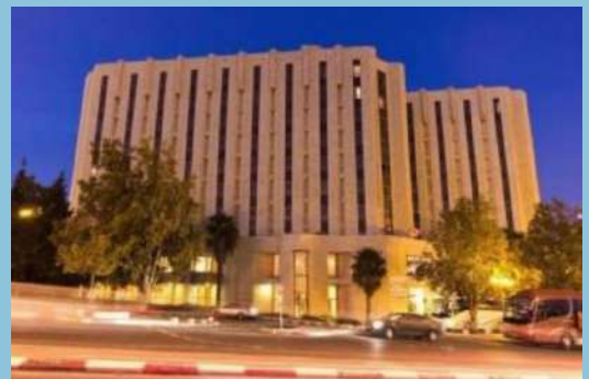
Hotel Royal Wing, Jerusalem

Vi besøker også Davids by med Hiskias tunnel og Siloadammen før det blir tid for å dra til hotellet og spise middag. Kveldsmøte etterpå.